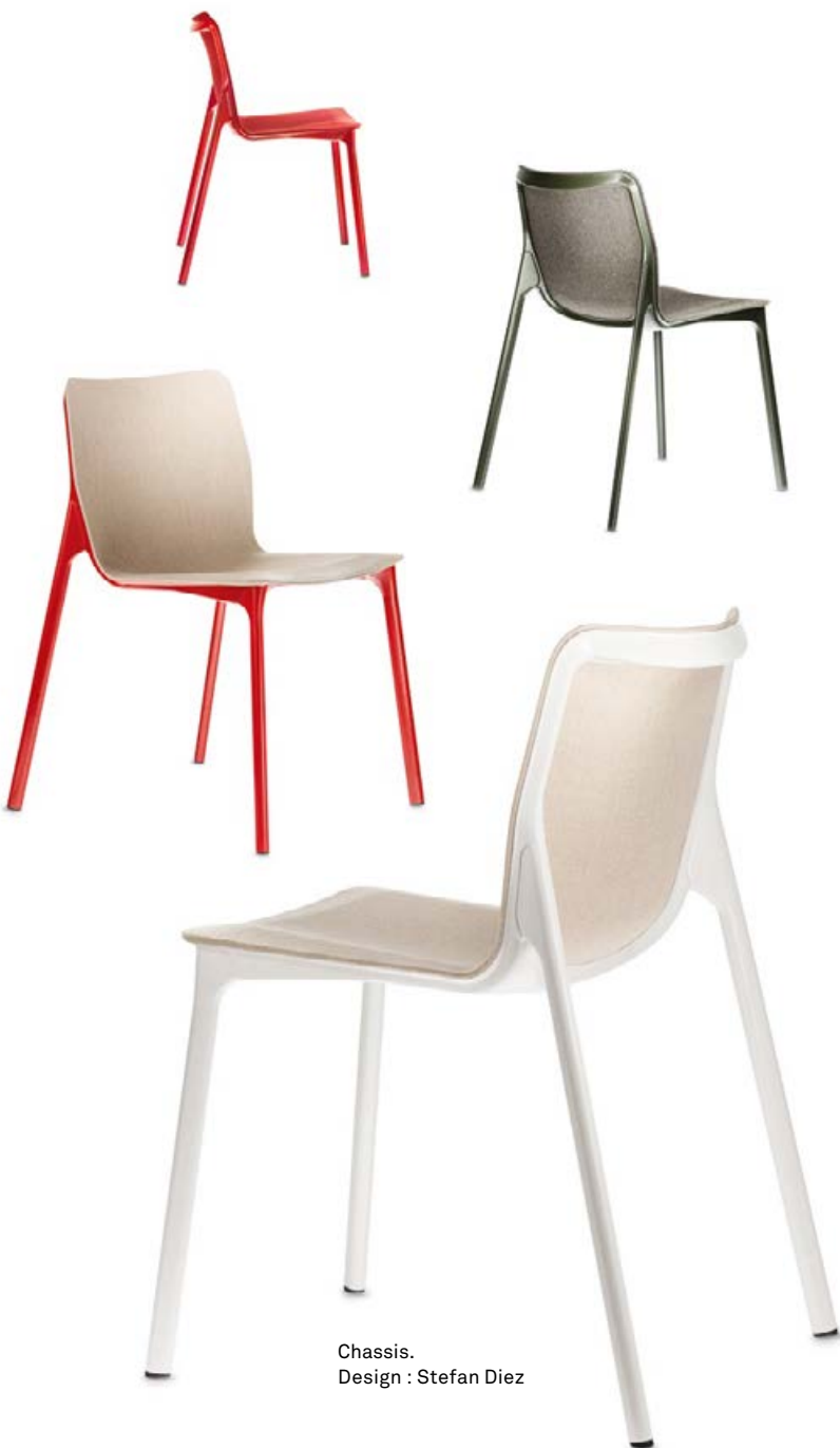
Chassis. Design : Stefan Diez

Peu de sièges ont eu autant d'impact dans les milieux internationaux de la création et du design : la chaise Chassis interpelle et surprend, avec son dessin caractéristique et son procédé de fabrication révolutionnaire, fondé sur l'emboutissage de tôles minces en acier. Cette technique, dite 'space frame', est empruntée à l'industrie automobile.