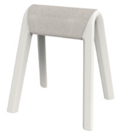
204/02 Sitzbock mit Satteldecke

Weitere Informationen unter: www.wilkhahn.com