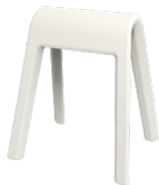
204/02 Sitzbock Weiß