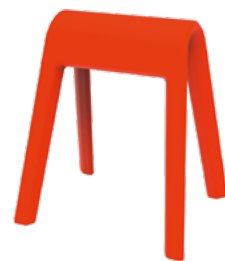
204/04 Sitzbock Orangerot