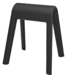
204/01 Sitzbock Schwarz

Auch kreuzweise übereinandergestapelt wird der Sitzbock zum Hingucker, der zur Interaktion einlädt.