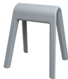
204/03 Sitzbock Grau