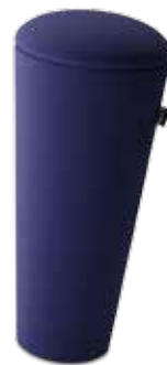
202/0106 Bleu foncé