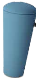
202/0103 Bleu clair